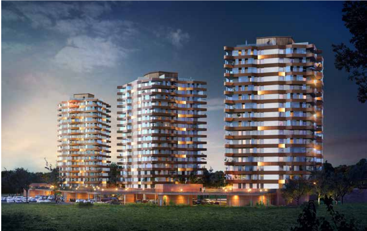
Bild: Tegelbruket i Halmstad som projekterats av Järngrinden AB med 3 punkthus och 330 lägenheter. Porttelefoni integrerat med Axema VAKA™ passersystem.