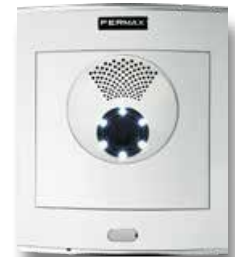
Kamera placerad separat