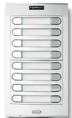
Knappsats placerad separat