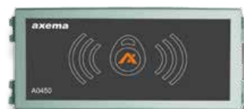
Kortläsare för Axema VAKA™ passersystem integrering