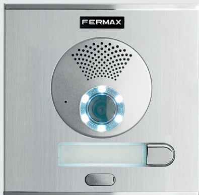
CityKit DUOX PLUS porttelefon med kamera